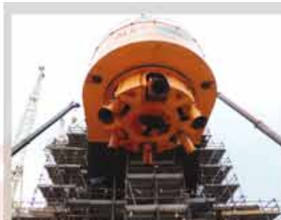
TORRETA ANCORAGGIO ALBA MARINA