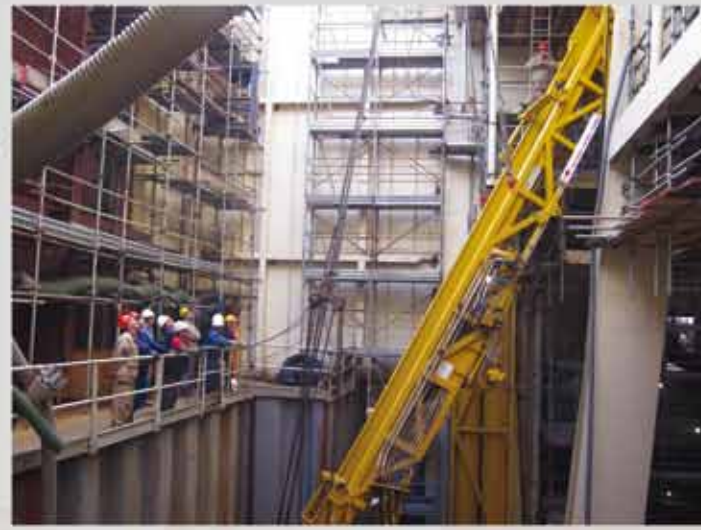
Installation of "Vertical Pipe Chute" on SAIPEM "SCARABEO 8" drilling rig (Fincantieri Palermo shipyard)