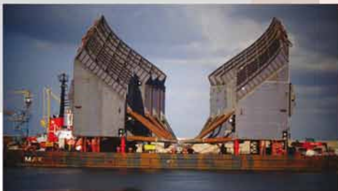
Blister Progetto Parbuckling - Costa Concordia

The Parbuckling Project for the Costa Concordia Wreck Removal - Supply and installation of the oleodynamic system for the BLISTER (Build in the Palermo Shipyard ) and assistance for material handling in Giglio Island.