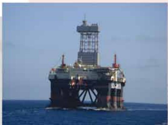
Scarabeo 8 - September 2010

- Overhead crane and drag sleds for X-mas tree movement installation (Baseplate Trolley & X-Mas Tree Skid)