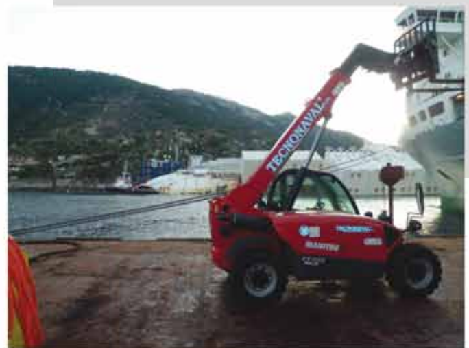
Relitto "Costa Concordia" Isola del Giglio

Vale inoltre la pena annoverare tra i prestigiosi incarichi ottenuti, quello ricevuto per conto della Titan-Micoperi nel Progetto Parbuckling per la rimozione del relitto della Costa Concordia al quale abbiamo partecipato con la fornitura e l'installazione dell' impianto oleodinamico del BLISTER (costruito presso il Cantiere Navale di Palermo) e l' assistenza per le movimentazioni in loco, sull'Isola del Giglio